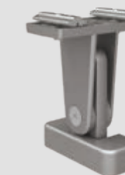
Pieds supports top pour installations alignées, réglables, en 3 hauteurs: 120-165, 165-210 et 210-255 mm