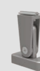
Pieds supports top, réglables, en 3 hauteurs: 120-165, 165-210 et 210-255 mm