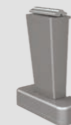
Pieds supports top, fixes, avec 4 hauteurs: 80, 120, 150 et 220 mm

WGM Top se décline dans les modèles Stretch et OptiStretch qui assurent une toile bien tendue. Dans le modèle OptiStretch , la toile est solidement tendue des quatre côtés. Les avantages: une toile particulièrement bien tendue et aucune fente de lumière sur les côtés. La version de base Stretch est tendue sur deux côtés et présente une fente de lumière entre la toile et le profilé latéral. Les deux versions disposent d'un système de tension de câble pour un positionnement optimal de la toile.